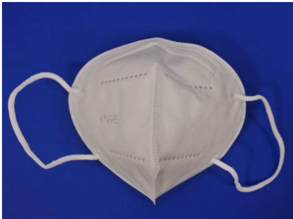
Frontansicht / Front view