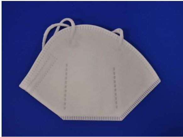
Seitenansicht ohne Aufschrift / Side view without inscription