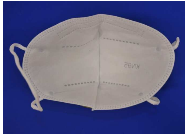
Innenansicht / Inner view