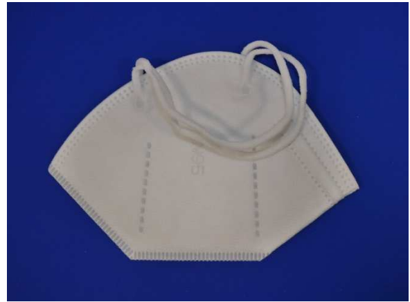
Seitenansicht mit Aufschrift / Side view with inscription