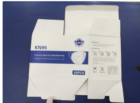
Verpackung / Packaging