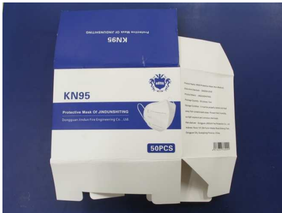
Verpackung / Packaging

Die folgende Maske wurde geprüft / The following mask was tested: