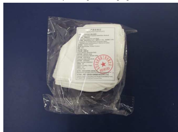
Verpackung / Packaging